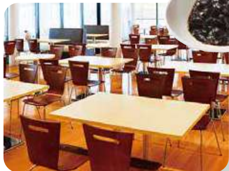
丹波大食堂(フードコート)