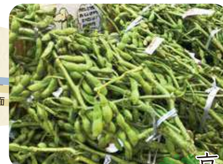
京丹波マルシェ「直売所」コーナー 京丹波産黒枝豆 ※10月頃