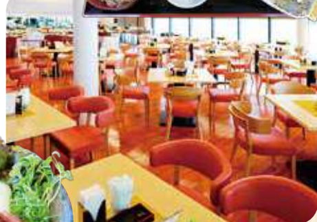
丹波里山レストラン Bonchi