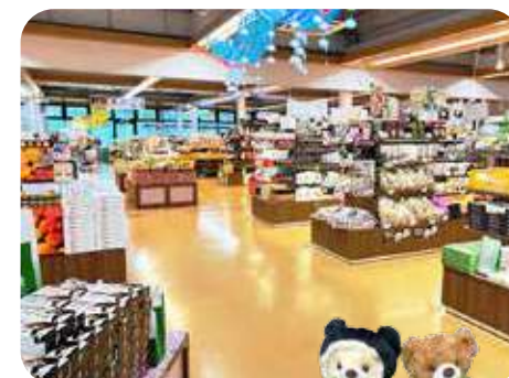
京丹波マルシェ 「京土産」コーナー