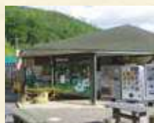
瑞穂の里 さらびき 京丹波町大朴血引1 番地4 電話 0771-88-9350