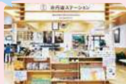
「京丹波ステーション」