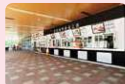
オープンカフェ・軒下コンコース